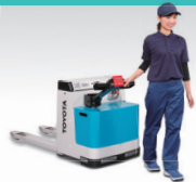
ローリフト (歩行型)