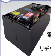
電動フォークリフト /けん引車用 リチウムイオンバッテリー ENELORE [エネロア]