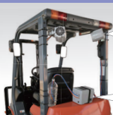
フォークリフト用ミストファン 霧風くん