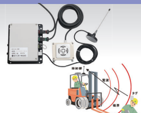
作業者接近検知システム (タグ式)