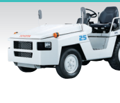
トーイングトラクター エンジン車

最大けん引量(けん引タイプ) 1.0ton 最大荷重(積載タイプ) 0.5~1.4ton