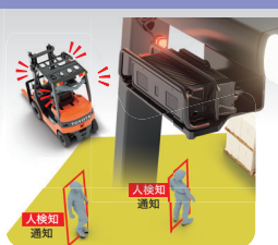
後方作業者検知運転支援システム SEnS[センス]