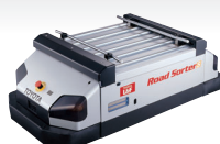
Road Sorter S [ロードソーターS]