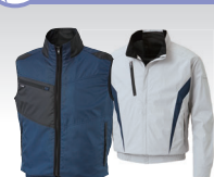
電動ファン付きウェア 空調風神服