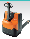
ミニムーバー (歩行型)