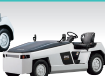
トーイングトラクター 電動車