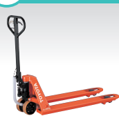
パレットトラック