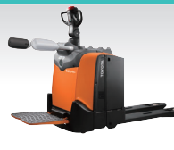
ミニムーバー (乗車・歩行兼用型)