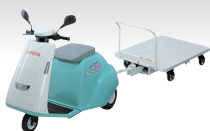
ユニエレカくるる 4WS台車スキッパー

最大けん引量(くるる) 0.6~1.0ton 最大荷重(4WS台車スキッパー) 0.5~0.6ton