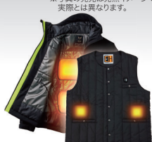
発熱体付きウェア 「雷神服」