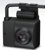
フォークリフト用 ドライブレコーダー