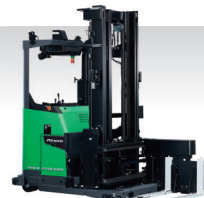
Rinova AGF RACK STOCKER [リノバ AGF ラックストッカー]