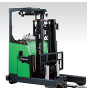
Rinova AGF [リノバ AGF]