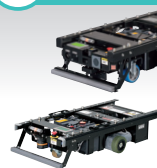
KEY CART [キーカート] 基本タイプ