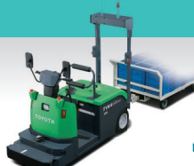
タグババ リモコン仕様車