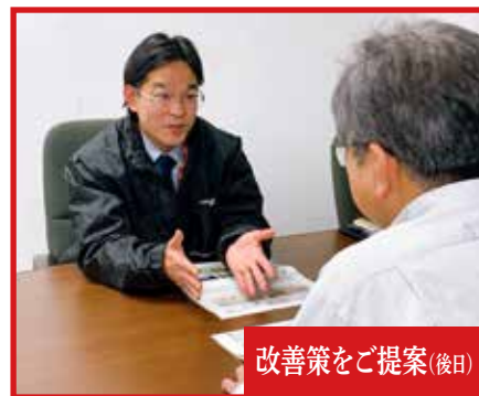
改善策をご提案(後日)